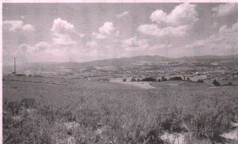
— 富良野 ラベンダーの丘 —

でした。「風のガーデン」は人気のスポットで植え込みのセンスの良さ、青空に似合う鮮やかな花色が多くて写真を撮りまくりました 旭りでは個人のお宅のオープンガーデンを見学させて頂きました 花の組み合わせや花づくりのコツなど教えてもらいながら、花を通じて地元の方と良い交流ができて花と語り合う良い研修になりました。