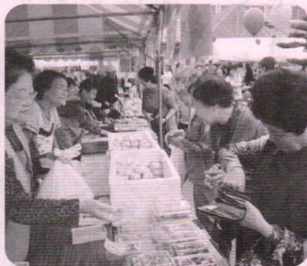
— 昨年の様子 —